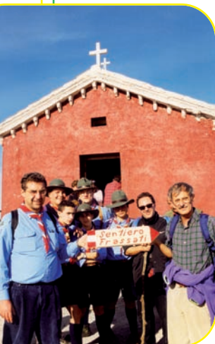
Il Cai con gli scout a Sito Alto

Ci si incammina in direzione di Sala, lungo un primo tratto attrezzato anche per persone in carrozzella e, in circa mezz'ora, si raggiungono i ruderi del monastero di Sant'Angelo in Fonti (XIV sec.). Poco più avanti si trova una spelonca (560 m) da cui ebbe inizio quel culto michaelico che più tardi si sarebbe sviluppato nel pieno della luce del colle della Balzata . Lo si raggiunge in circa due ore e mezzo, percorrendo da ultimo un dolce sentiero a serpentina che – evitando i tornanti asfaltati – ridà il gusto di salire al santuario di San Michele (986 m) calpestando la nuda terra. L'immagine più antica dell'Arcangelo – forse di mano cinquecentesca – è affrescata nell'abside dell'originario